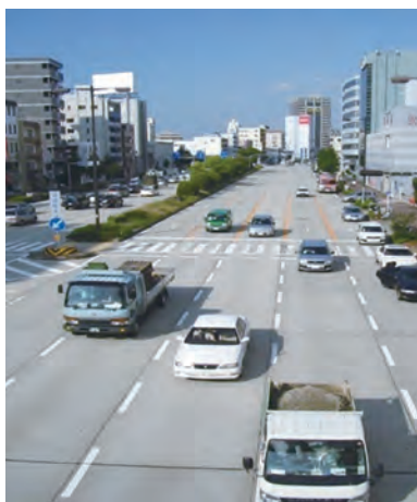
コンクリート舗装