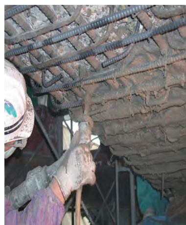
セメント系補修材

いますぐクリック! jcafukyu.jp 本講座はテーマごとにシリーズ化いたします 定期的なチェックをお願いいたします