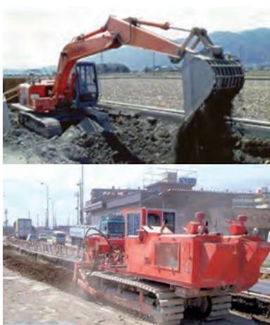
セメント系固化材